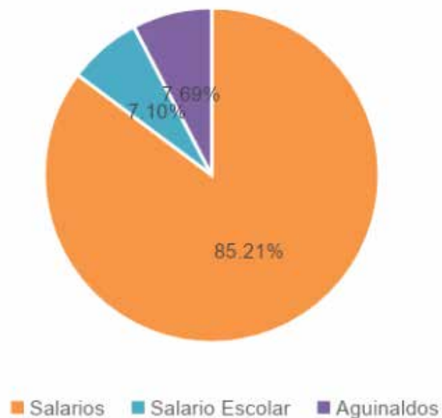
Figura N° 2. Distribución porcentual servicios personales para el 2024.