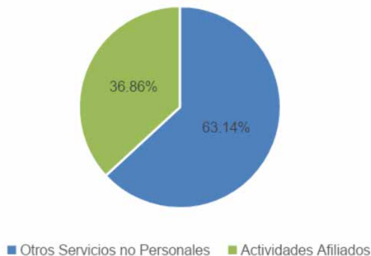
Figura N° 3 Distribución porcentual servicios no personales para el 2024.