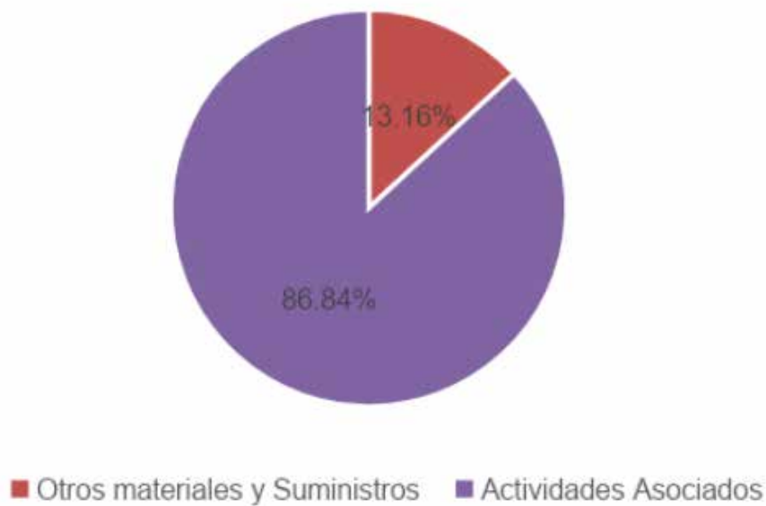
Figura N°4. Distribución porcentual de materiales y suministros para el 2024.